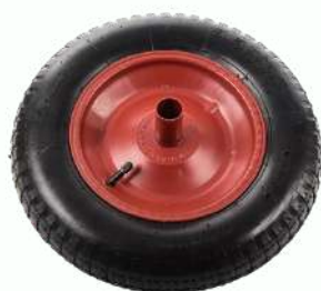
Pneu e Câmara