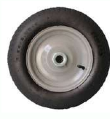
Pneu e Câmara com rolamento