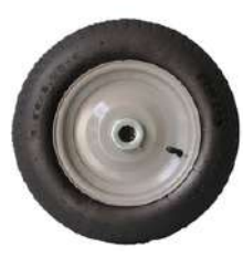
Pneu e Câmara com rolamento