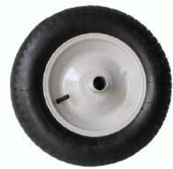
Pneu e Câmara